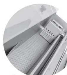
Canal inclinado con resalte, para limitar la fricción