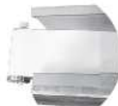
Opcional cinta de salida